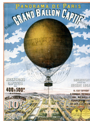
▲ Cette affiche fait la promotion du grand ballon captif des Tuileries de 1878.

Dernier point d'orgue de cette histoire : la vasque olympique. Le chapitre revient sur la conception de ce ballon lumineux imaginé par Mathieu Lehanneur, sa flamme sans combustible conçue par EDF, son envol depuis les Tuileries et le secret qui a entouré l'une des images les plus fortes des Jeux de Paris 2024.