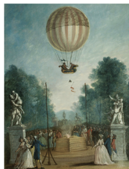
▶ Le physicien Jacques Charles et l'ingénieur Nicolas-Louis Robert (1759-1798) embarquent dans leur ballon, qui décolle du bassin central du jardin des Tuileries, le 1 er décembre 1783.