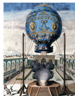
◀ C'est à Paris, au 35 rue de Montreuil (11 e arrondissement), qu'a lieu le premier envol de passagers. Le ballon est captif, retenu par des cordages. Eau-forte colorée, gravée d'après un dessin de Claude-Louis Desrais, fin du XVIII e siècle.